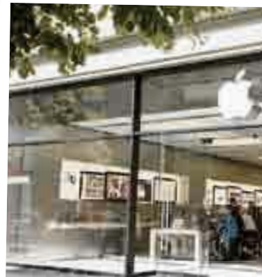
Wie in Zürich Apple sucht dringend ein Lokal für den Berner Store.

Weltmarken kämpfen erbittert um einen Laden unter den Lauben. Das treibt die Hauspreise in schwindelerregende Höhen.