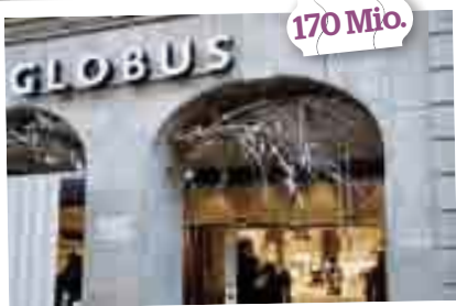
Beliebt Die Lokalität von Globus ging für etwa 170 Millionen über den Ladentisch.