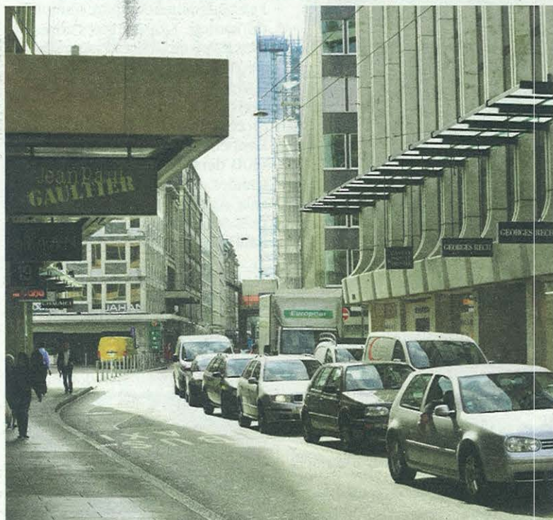
La rue du Rhône est particulièrement chère. Les loyers y approchent les 8000 francs par mètre carré et par an. LAURENT GUIRAUD